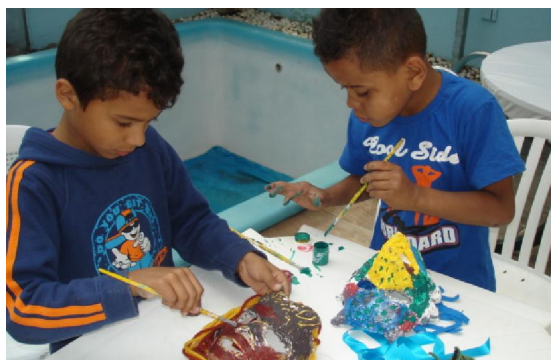
Pintando e enfeitando máscaras.