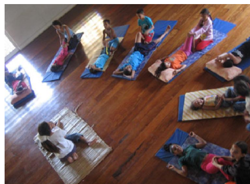
Crianças em prática de massagem thai.