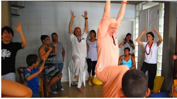
Prática de respiração com familiares e voluntários.