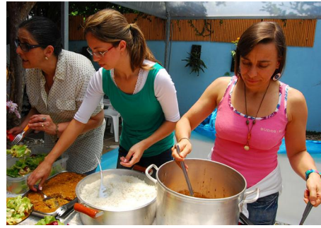
Voluntários servindo o almoço.