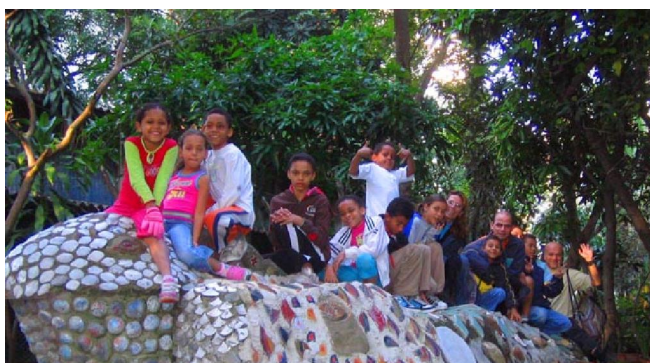
No teatro Vento Forte.