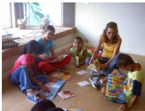
Em atividade na Casa Francisco.