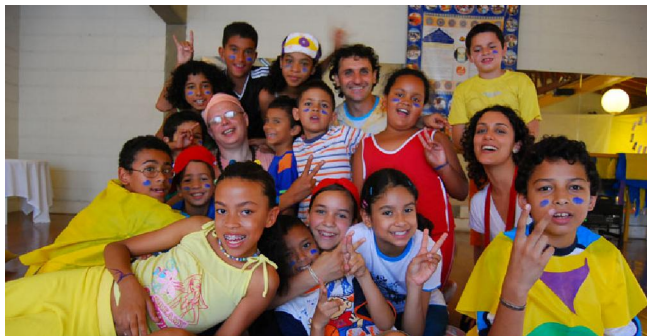
Crianças e voluntários com Swami após a apresentação.