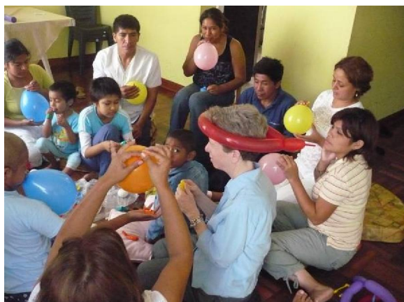
PASSO n.5 Inflamos os balões para que ficassem macios