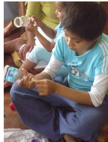
PASSO n.6 Colocamos o balão na abertura da garrafa.