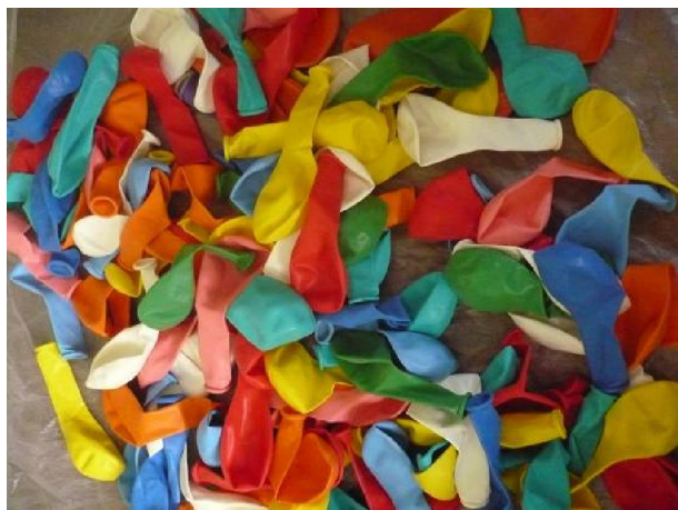
PASSO n.1 - Escolhendo os balões